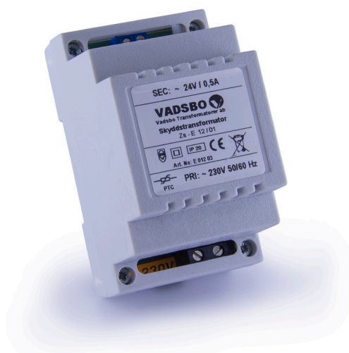
12 VA V-2401224

Normkapslade skyddstransformatorer för DIN-skenemontage 12-35 VA. Sekundärt spänningsområde 24V. Kortslutningskydd. Överbelastningskydd. Kapslingsklass IP20.