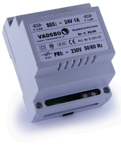
24 VA V-2402424