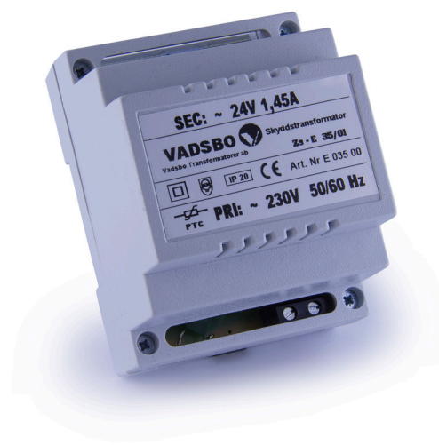
35 VA V-2403524